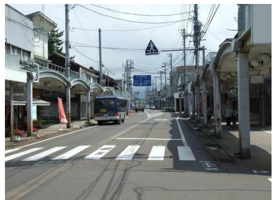
中心商店街の現況