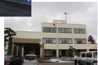
整備後の水原公民館（市民交流拠点の確保）