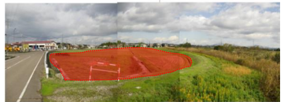
▲地区の整備前状況（小学校予定地）