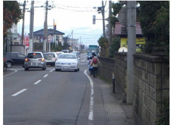
歩道がない通学路