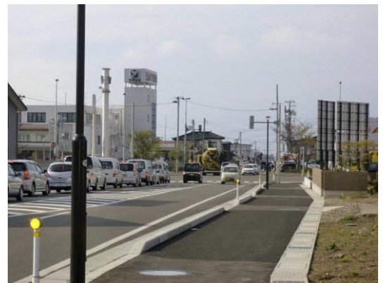
整備後状況（歩道整備完了）