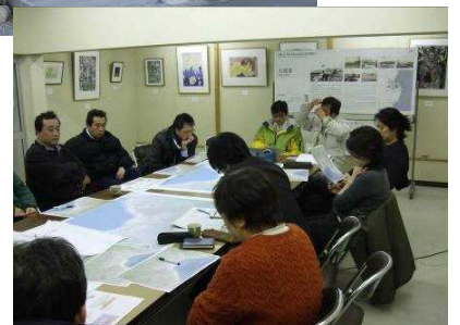
▲まちづくり活動の拠点とまちなみ調査