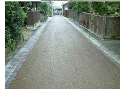
▲史跡めぐり散策路 整備前(上)、整備後(下)