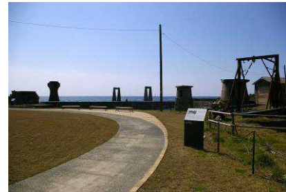
▲明治初期に建設された「近代化遺産」。金鉱石の精錬所跡地（上）と積出港だった大間港（下）