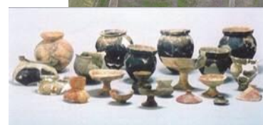
▲平地性環濠集落「釜蓋遺跡」と出土土器