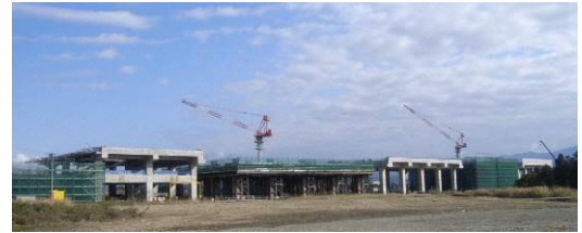
▲（仮称）上越駅予定地付近の建設状況