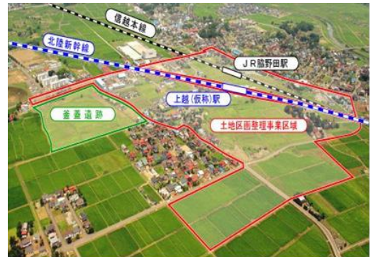
▲北陸新幹線（仮称）上越駅建設地

発掘調査による資料・データの蓄積と合わせ、釜蓋遺跡を上越市の歴史や文化を発信する拠点として整備・活用していくための保存活用計画を策定する予定である。