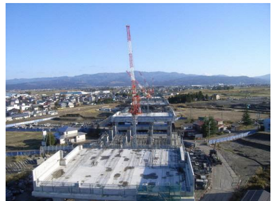
▲（仮称）上越駅予定位置から長野・東京方面を望む