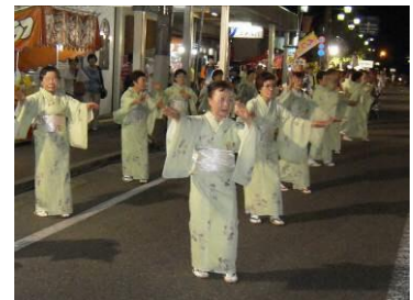
▲ 五泉駅前のにぎわい（きなせや祭り）

地域の声を反映しつつ、官民一体となって取り組むため、五泉駅周辺整備計画が策定された。