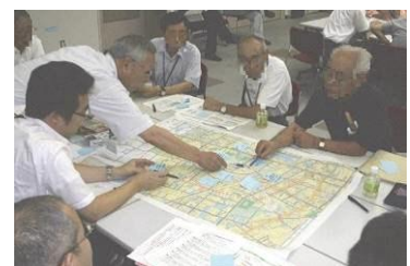
▲ 五泉駅周辺整備市民懇談会の様子