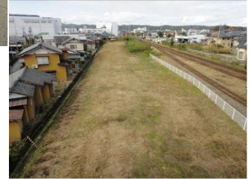
▲ 整備前の五泉駅周辺の様子