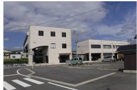
▲ 中央連絡橋と五泉地域包括支援センター