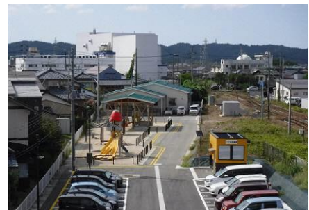
▲ 学童クラブ及び子ども広場