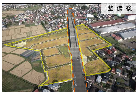
▲ 土橋南土地区画整理事業

地域住民のコミュニティ形成とまちづくりへの関心・意識向上を図るため、住民が主体となった土地利用計画の検討や勉強会の開催などに対して支援し、本事業をきっかけに継続的なまちづくり活動を実現する。