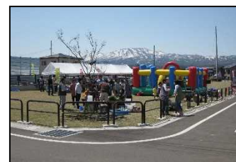
▲ イベントでにぎわう公園