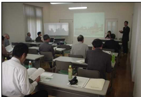
▲ 地権者勉強会の様子

土地区画整理事業の実施にあたり、単に居住環境の整備・提供だけでなく、「自分たちのまち」として誇りに思えるようなまちをつくるため、地権者勉強会を重ねていく。