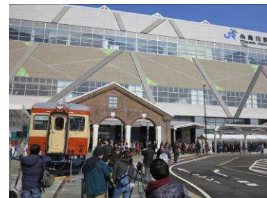
移築したレンガ車庫モニュメント(H27.3)