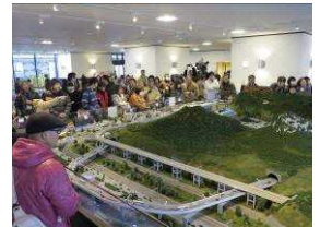
完成したジオラマ(H27.3)