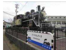
C12 を展示したポケットパーク