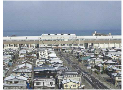
完成した北陸新幹線糸魚川駅と周辺(H27.3 現在)

レンガ車庫は地域固有の施設として市民団体の根強い保存運動があり、新幹線駅南口にその一部を再現することになった。