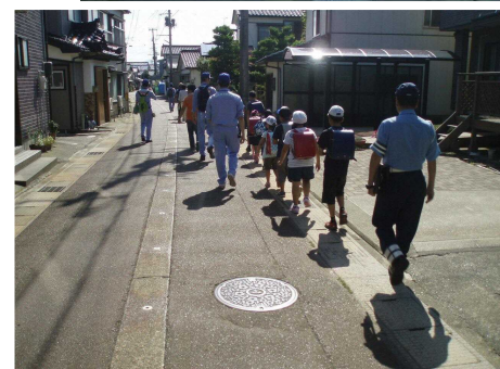
▲整備された道路側溝