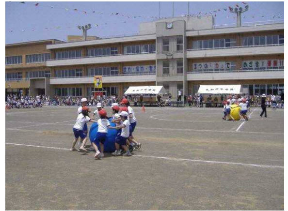
▲当地区の中心にある大和川小学校

歩きやすい道路の整備については、道路管理者などの関係機関との協議により道路計画の作成後、地元関係者、地権者への説明会において事業の趣旨説明と協力要請。