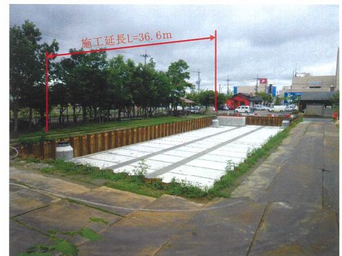
▲公園を活用した調整池の設置