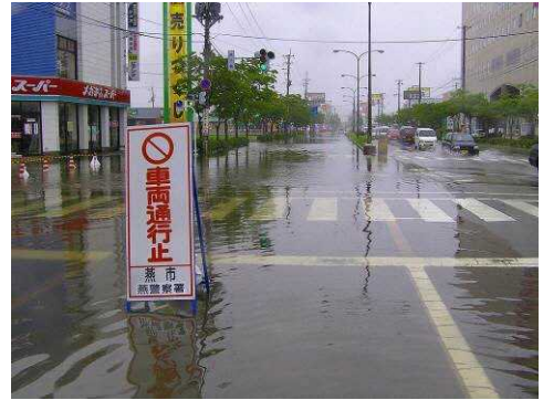
▲雨で浸水被害が発生し通行止めとなる

公園整備後の管理運営については、現在須頃郷 2 号公園の管理を行っている NPO 法人「ネットワークみどり緑」との連携・協働を検討するなど、公共空間における緑の演出を通じて地域住民が主体となった継続的なまちづくり活動へと展開を図る。