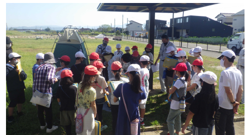
▲東町公園 校外学習の様子