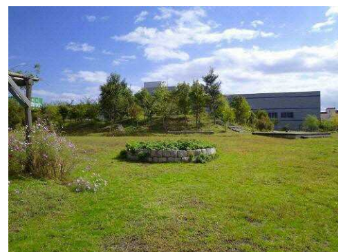
▲NPO法人「ネットワークみどり緑」が管理・運営する三燕みどりの森公園