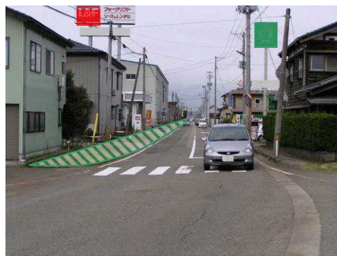
▲市街地へと進む道路の歩行者空間が確保できていない