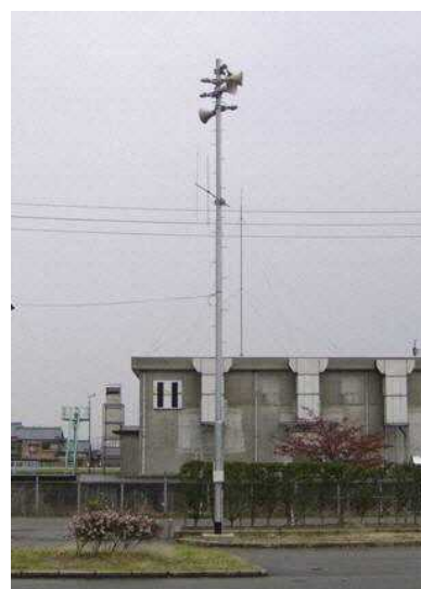
▲屋外拡張子局設置及び既存設備のデジタル化

また、それぞれの事業を円滑に効率よく推進していくために、地元の各団体と行政とがその事業の進捗状況、成果、評価、を協議する会合を開催していく。