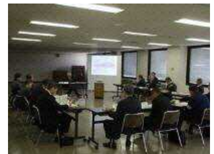
▲都市計画決定に係る都市計画審議会の様子

平成23年には今回住宅地を整備する柳橋地区を市街化区域に編入し、隣接する既存住宅地との整合性を勘案し住居系の用途地域を指定した。また、同時に緑豊かで良好な住宅地の形成を趣旨とする地区計画も策定している。