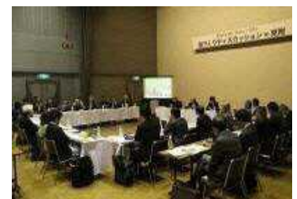
▲街づくりディスカッションの様子

日経BP社等が主催し新しい街づくりを検討するプロジェクト「プロジェクト エコシティ」の一環として、有識者、企業が集い、柳橋地区の住宅地を先例のない魅力的な街にするための検討会を実施した。