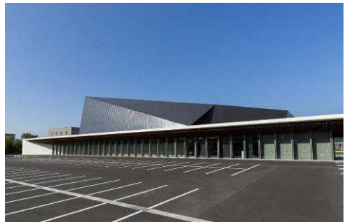
▲地域交流センター「段十ろう」