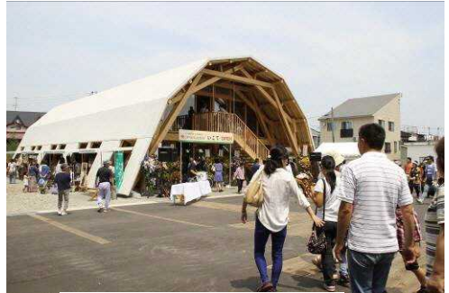
▲産業文化発信館「いこて」