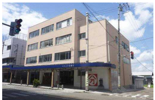
▲▼「分じろう」「十じろう」の施設設計における協働の取組みは、グッドデザイン賞ベスト 100 を受賞