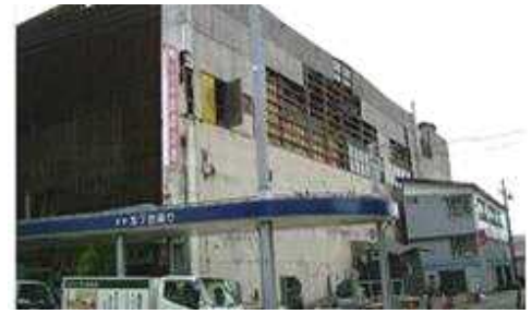
▲H16 中越地震により被災し撤退した大型商業ビルや、廃業した工場跡地等が市内に点在・・・

平成 22 年度より新中心市街地活性化基本計画の策定に取組み、市民や商店街振興組合、十日町 TMO といった関係団体ともワーキングを重ね、基本計画の策定を行った。平成 25 年 6 月に認定を受け、都市再生整備計画区域と中心市街地活性化基本計画区域は一致したエリア設定としている。