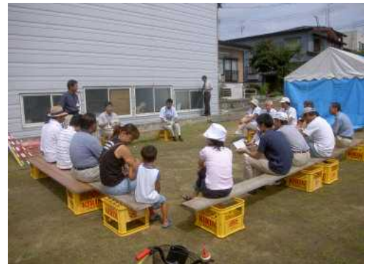
▲ 公園整備ワークショップの様子

公園整備については、地域住民とワークショップを開催し、新潟県中越地震における避難生活の経験から、災害時の仮設トイレ・生活雑用水・備蓄倉庫の必要性が提案され、公園の設計に反映された。