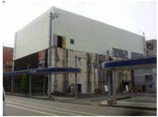
▲ 中心市街地に点在する放置空き店舗