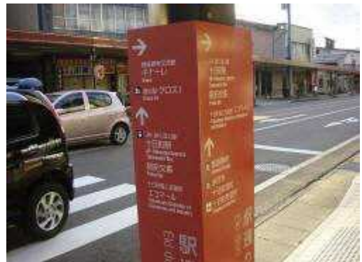
▲ 街の角々に設置された歩行者案内板

新潟県唯一の国宝である火焰型土器群が出土した笹山遺跡の保護と活用を図るため、地域住民が実施している活動の支援。