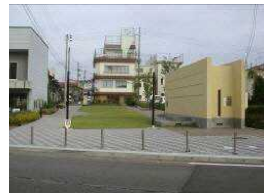
▲ 地域住民の発案を取り入れた公園