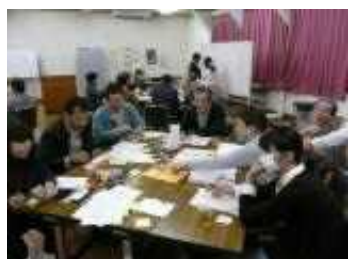
▲ ワークショップの様子