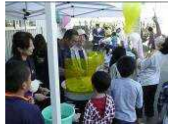
▲ 地域コミュニティ活動の様子

葛巻地区の計画策定にあつては、地域住民とワークショップを開催し、地域交流の促進や地域コミュニティの活性化を図るために必要となる事業の検討・提案がされた。これら提案を基に、都市再生整備計画の立案を行った。