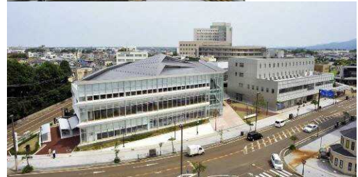
▲駅前複合施設（イクネスしばた）の整備前と整備後の状況（左：行政棟、右：民間棟）