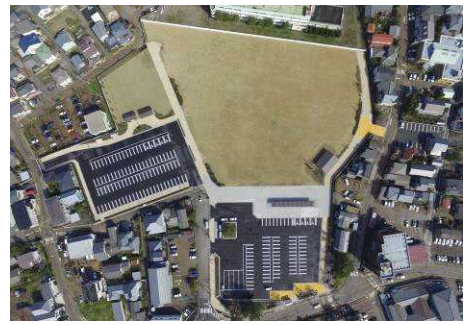
▲新発田病院跡地の二ノ丸公園（アイネスしばた）