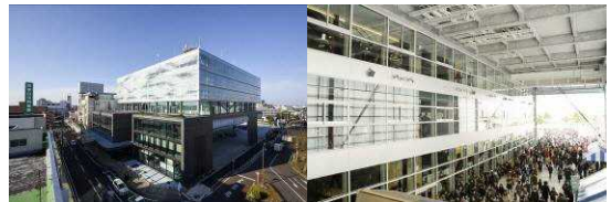
▲街中に建つ新庁舎（ヨリネスしばた）半屋内のイベント広場「札の辻広場」