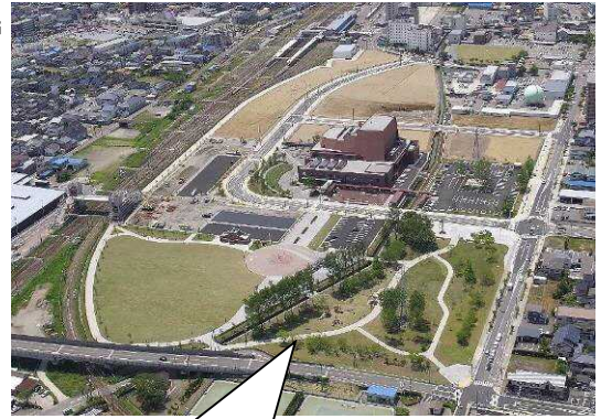
整備が完了した柏崎駅前 土地区画整理事業地の状況

中越沖地震により中心市街地の商店街や住宅が大きな被害を受け、特にえんま通り商店街では多くの家屋商店が全壊など大きな被害を受けた。商店主も高齢者が多く、住宅も混在している中①震災からの復興、②地域のまちづくり、③商店街の復興・再生を目指していく。