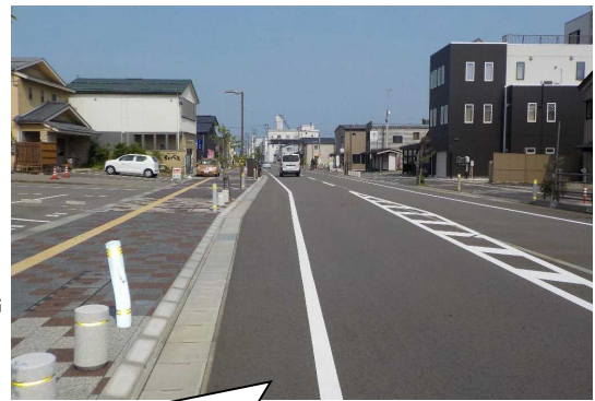
事業完了後のえんま通り商店街

平成19年度～平成23年度の前期基本計画の重点プロジェクトの中のまちなか再生プロジェクトで柏崎駅周辺には、広大な工場跡地が存在していることから、これらを再開発し、公共公益機能、商業機能、業務機能、文化機能、居住機能などの複合機能を配置して、賑わいのある空間を創出することとした。