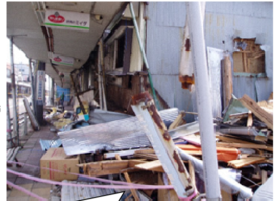
中越沖地震直後のえんま通り商店街

震災の被害を受けた商店街について、地域住民による再生に向けた取り組みを支援すべく、研修、ワークショップ等を開催する。