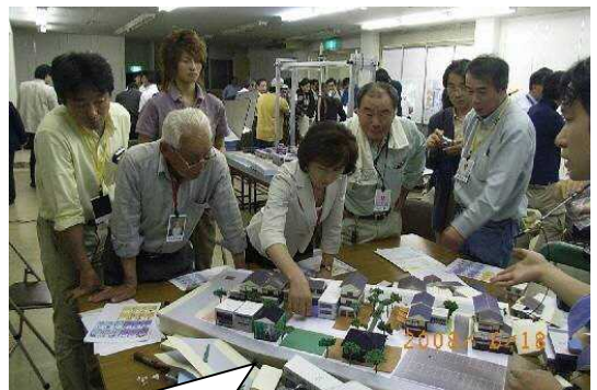
震災からの復興を目指すえんま通り復興協議会