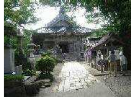
高台にある番神堂

海浜公園砂浜に、水上バイク等レジャー船舶の搬入用施設を整備し、マリレジャー利用者の利便性向上を図る。