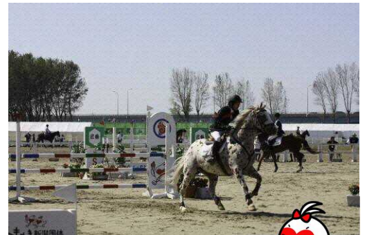
信濃川河川敷・旧三条競馬場でのトキメキ新潟国体馬術競技