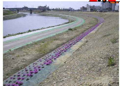
市民植栽による五十嵐川堤防法面のシバザクラ