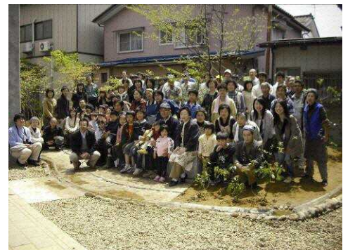
市民参加によるJR弥彦線高架下ポケットパーク整備