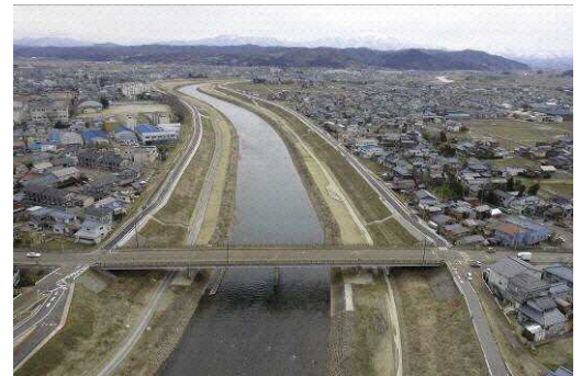
復旧した五十嵐川

さらに、これまで五十嵐川河川敷で行われていた凧合戦などのイベントを、災害以降は信濃川河川敷の競馬場跡地で行っており、三条・燕総合グラウンドとの一体的な利用の中で、交流拠点としての強化が求められている。