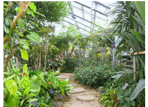
保内公園 熱帯植物園温室