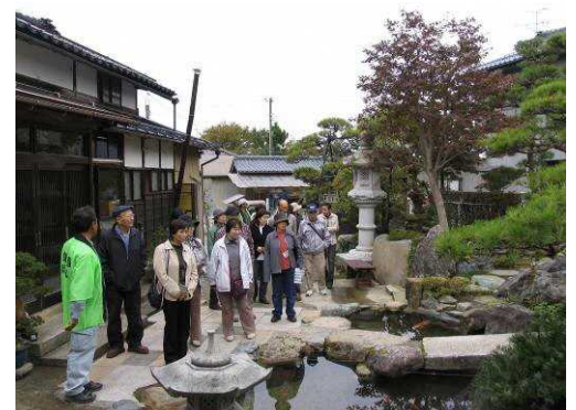
オープンガーデン巡り

地元と三条市では、先進地視察を行うなど、具体的な事業の方向性・内容などの検討を行ってきた。