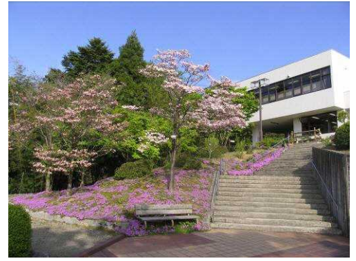
保内公園 緑の相談所

このような状況のもと、地域産業が衰退している中で、植木産業の振興、緑あふれる自然環境を活かした観光・交流のより一層の振興、オープンガーデンの利活用や里山散策などの新たなニーズへの対応、保内地区へアクセスするうえで重要なJR保内駅及び国道403号の降雨時の浸水対策といった緑の里として発展していくための更なる基礎づくりが求められている。