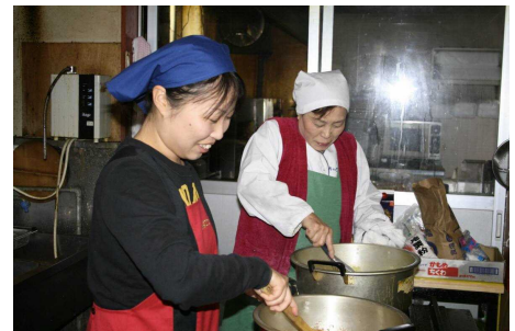
特産のサツマイモの加工作業