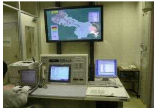
▲ 整備された防災通信施設