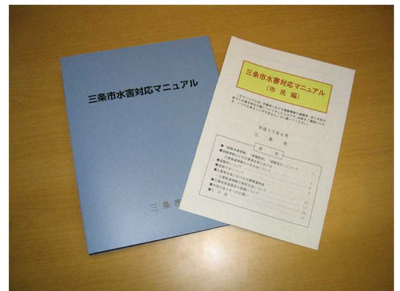
▲ 水害対応マニュアル（左：職員用） 同 市民編（右：市民用）