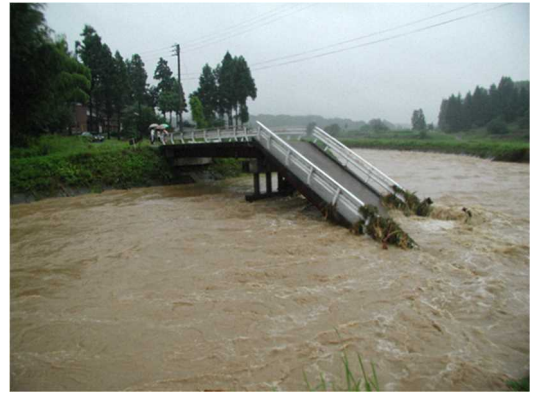
▲ 濁流により落橋した栄雲寺橋

市町村合併により市域が拡大したため、災害時等において住民への情報伝達手段を確保するために、燕三条FMの送信所の移設と中継局の設置を行い、同報系防災行政無線システムとの連携を図ることにより、風雨などにより防災行政無線スピーカの音声聞き取りづらい状況においても、このFM放送からタイムリーな情報を得ることができる環境を整備し、合併後の新市域全般における情報通信格差の是正を図る。