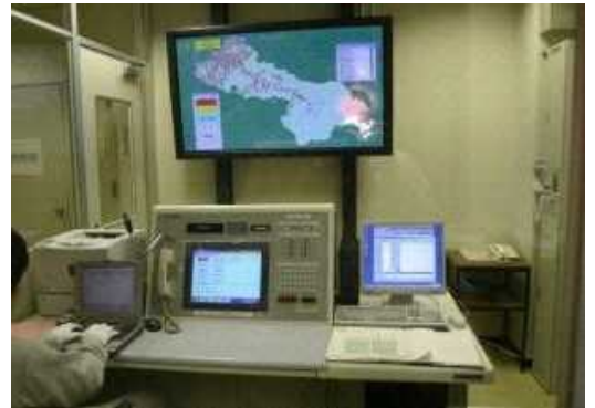
▲ 整備された防災通信施設