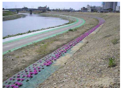
市民植栽による五十嵐川堤防法面のシバザクラ