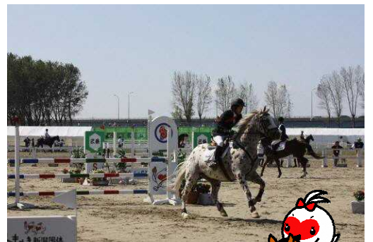
信濃川河川敷・旧三条競馬場のトキめき新潟国体馬術競技