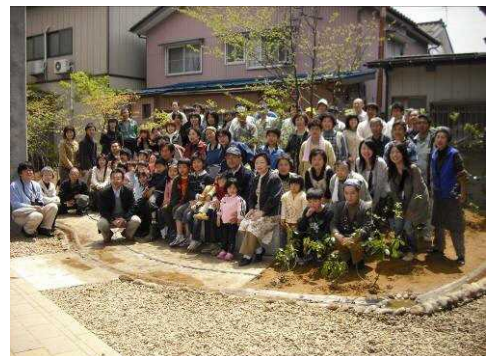
市民参加によるJR弥彦線高架下ポケットパーク整備