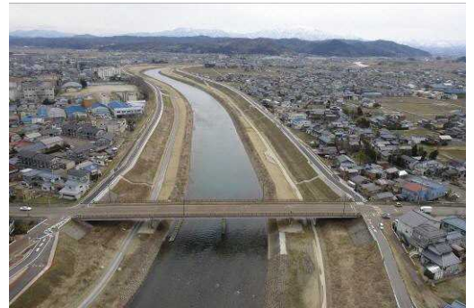
復旧した五十嵐川

都市的な景観の視点から、地域の特性を十分に活かし、市街地における良好な景観の保全と創出を図るため、改修後の五十嵐川の景観と市街地景観の調和について検討するとともに、市街地の魅力ある街並みなどの調査等を行い、景観づくりのための基本的な考え方や実現化に向けた具体的施策の検討が行われた。