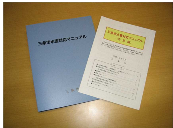
▲ 水害対応マニュアル（左：職員用） 同 市民編（右：市民用）

災害発生時において、冠水した地域の排水、災害復旧活動として泥出しを行う際防火水槽等からの給水等を行い、地域防災力（機動力）の強化を図る。