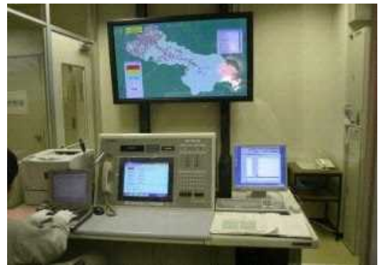
▲ 整備された防災通信施設