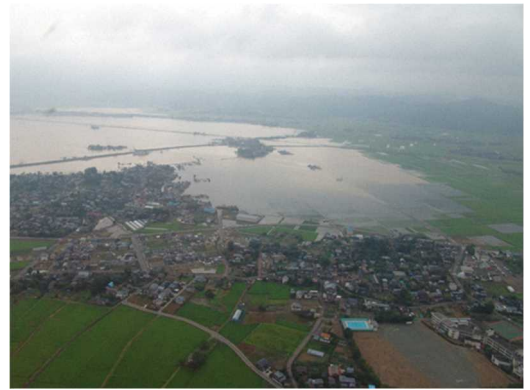
▲ 市街地に迫る濁流

今回の災害では、①水害であれば水害に特化した形での対応マニュアルが整備されなかったこと等により災害対策本部内でも非常に混乱してしまい組織内の情報伝達が徹底されなかった、②住民等に避難情報等を迅速かつ正確に伝達できる広報手段がない中、住民等における災害時行動の起点ともなる避難勧告情報等の災害関連情報について、広報車等による広報活動に頼らざるを得ない状況となり、結果的には、全ての住民等にこれらの情報が十分伝わらなかった、③泥水害とも言える状況の中、各施設・家屋・工場等の災害復旧の第一歩となる泥出しをまずは行わなければならないところ、断水が生じたため、泥出しを行うために十分な水を供給できる環境が整わなかった、といった解決しなければならない諸課題が浮き彫りとなった。