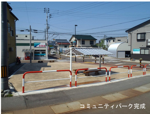
コミュニティパーク完成

また、地区住民・行政及び長岡造形大学による検討から、空地利用事業及びコミュニティパーク整備事業等の実施計画を策定した。