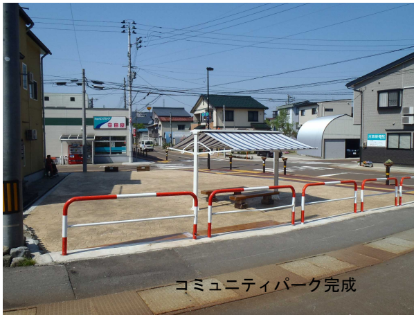
コミュニティパーク完成

また、地区住民・行政及び長岡造形大学による検討から、空地利用事業及びコミュニティパーク整備事業等の実施計画を策定した。