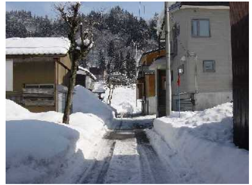
東川口地区まちづくり協議会