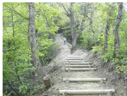
▲ 城山遊歩道（謂われのある現道を活かした園路として整備）

新潟大学との協働により、これまでの取り組みの記憶と今後の持続的な活動の拠点となる雁木の駅を整備し、「表町の雁木づくり」の更なる充実を図る。