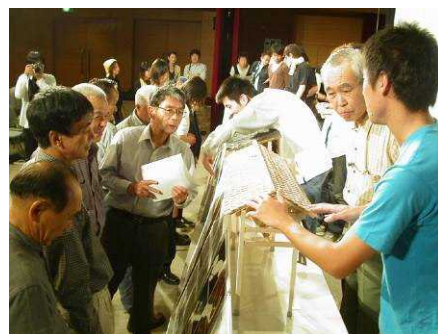
▲ 新潟大学の学生と地域住民による雁木づくりの様子