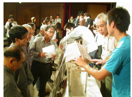
▲ 新潟大学の学生と地域住民による雁木づくりの様子