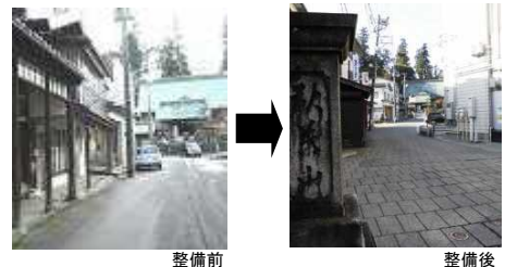
▲ 常安寺参道の整備（昔の面影を意識した参道として整備）