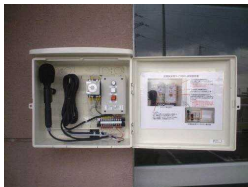
▲富岡亀小FM扩声器非常用マイク