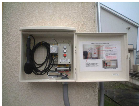
▲十日町小FM拡声器非常用マイク