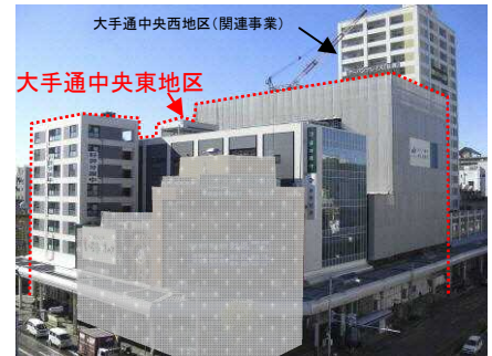
▲ 市街地再開発事業