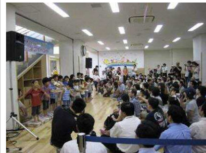
▲ まちなか子育て施設活用事例(大手通中央西地区)