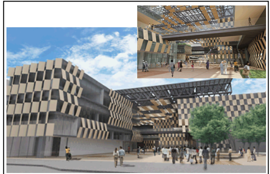
▲ シティホールプラザ「アオーレ長岡」完成イメージ(厚生会館地区)

新時代に向けた市民との協働によるまちづくりを実現するため、「長岡市中心市街地活性化協議会」(H19.11 設立)を核として、市民、中心市街地内各商店街、市等との協働による「まちづくり体制」を展開中。