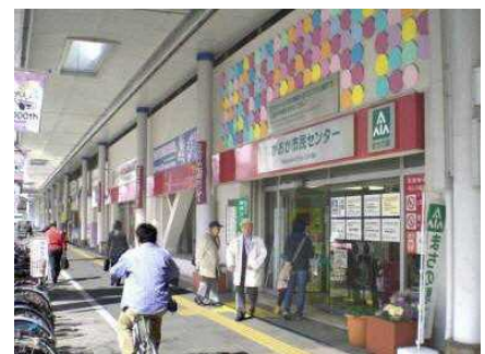
▲ ながおか市民センター(正面入口)