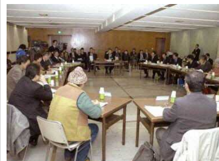
▲ 中心市街地構造改革会議の様子