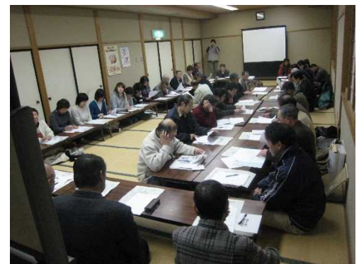
東川口震災復興委員会