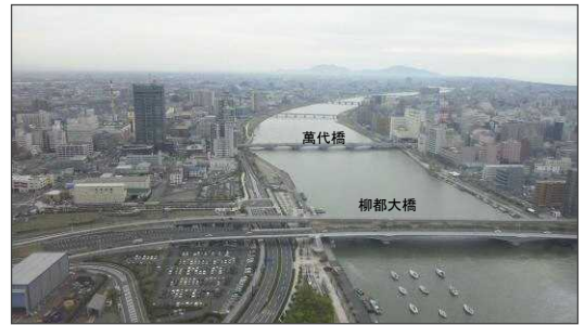
信濃川河口部より上流を望む