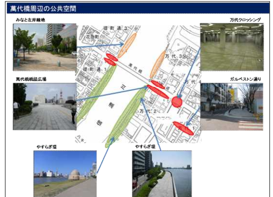
萬代橋周辺の公共空間