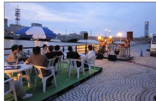
萬代橋サンセットカフェの様子

快適な都市空間を守り、開放感のある都市景観の形成に向け、萬代橋から見る景色を守る仕組みと、萬代橋が見える景色を創るため、視点場や回遊動線、また、景観ルールづくりなどの計画策定を行う。