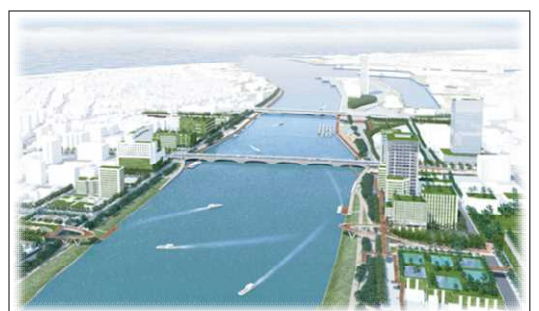
国土交通大臣賞「NIIGATA Central park」より