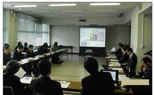
萬代橋周辺まちづくり協議会の様子

萬代橋周辺地区を対象地区として、「新潟の都心軸と信濃川の水辺空間が交差する」萬代橋周辺の魅力を活かした都市デザインの創出をテーマに、萬代橋や信濃川を活かした新たな魅力づくり、周辺と連携した賑わい・回遊空間の形成、良好な景観形成等のための様々なアイデアと都市デザインについて、全国から提案を募集した。