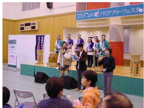
▲ 障害者と健常者との交流イベント

橋上駅舎の開設に伴い、広くバリアフリーに関する知識を深めることを啓発する目的で、バリアフリー推進イベントを開催。