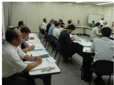
▲ バリアフリー施設検討会の模様

駅周辺を中心としたバリアフリー設備に関して、各障害者団体の方から議論していただき計画段階でのバリアフリー施設整備に関して改善点を見出し、駅舎や駅周辺整備に向けての施設整備を検討した。