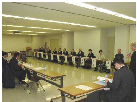
▲ 都市計画マスタープラン検討委員会

住民が真に暮らしやすい都市をめざすことを基本理念に掲げ公募による住民代表を検討委員会に交え、都市計画マスタープランを策定した。