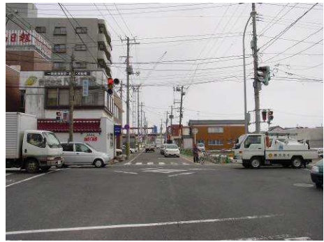
▲ 旧態然とした駅前通り

駅からのアクセス道路・バリアフリー施設が不十分であるため、駅を中心として整備を行っていく。