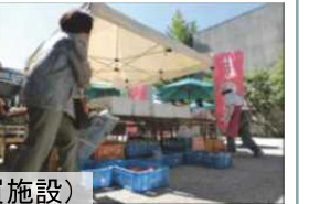
直売所(購買施設)