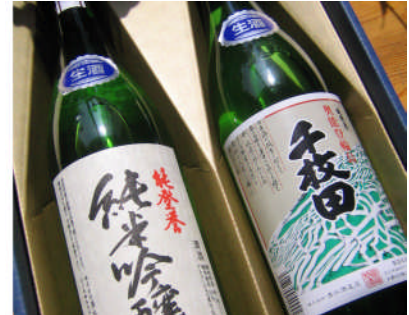
【協力者へ贈呈された土蔵からのプレゼントⅠ】