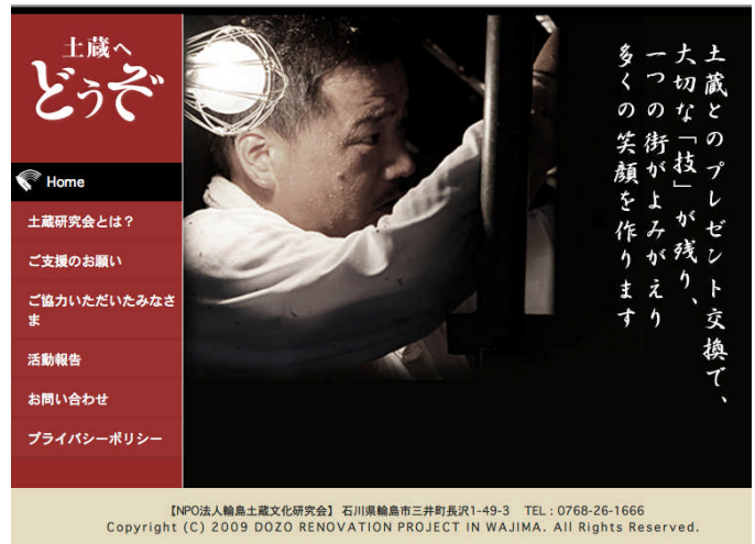
【地元職人と漆芸研修生の協働作業により完成した土蔵からのプレゼントⅡ】