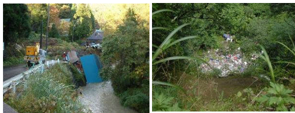
土砂災害と谷への不法投棄 (中ノ俣集落)