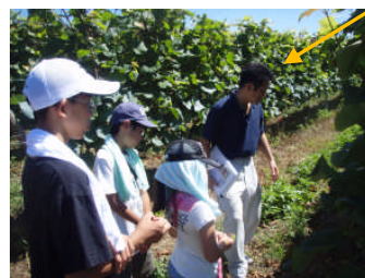
【生協グリーンライフ、ブドウ農園見学】