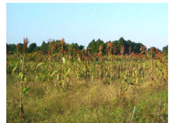
【休耕田を活かした穀物作り】