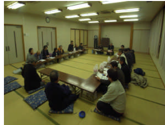
【農家民泊および指導者養成に関する説明会】