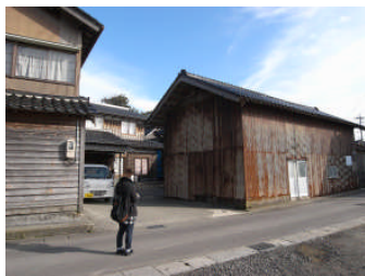
【空き家・空き農地の調査】

全2回の講習会によって、文部科学省認定小学校長期自然体験活動補助指導者を61名要請。