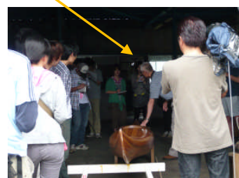
【長野大学ツアー、カーヌ工房見学】