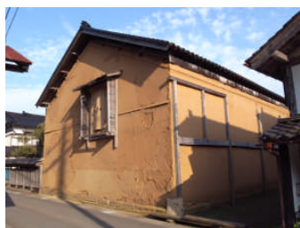
【当該地区にある大型蔵】

自然体験活動指導者の指導の下、生協グリーンライフ「里山里海子ども村ツアー」と長野大学体験ツアーの受け入れ。