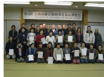
【自然体験活動指導者養成講習会】