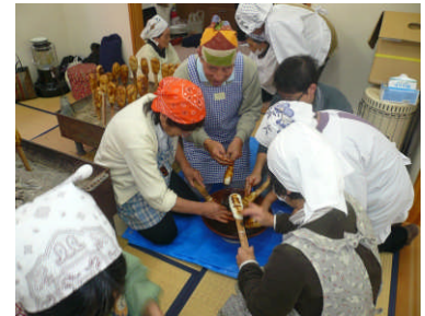
マタギ伝承料理「やるもち」を特産化することを目的にイベント開催