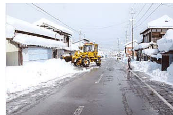
【市内でも最も降雪量が多い赤谷地域】