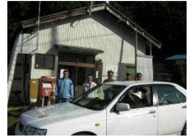
ボランティア輸送による生活交通対策の実施

コミュニティビジネス部会：耕作放棄地対策として「そばオーナー制度」実施 地域特産品づくり。猿害対策として、猿追払い隊の設置。