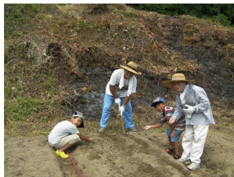
加茂市から参加したそばオーナー

今後もこのような手法を通じて一過性のイベントではなく本当の信頼関係が育まれる交流を行って行きたいと考えている。