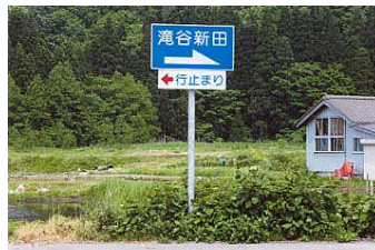
【高齢者化等による耕作放棄地増加】