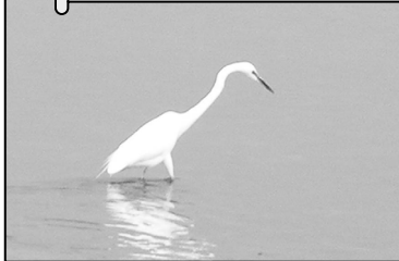
チュウサギちゃん