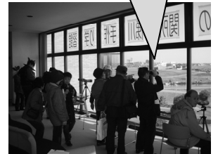
平成22年2月観察会の様子 室内からも鳥を観察できます