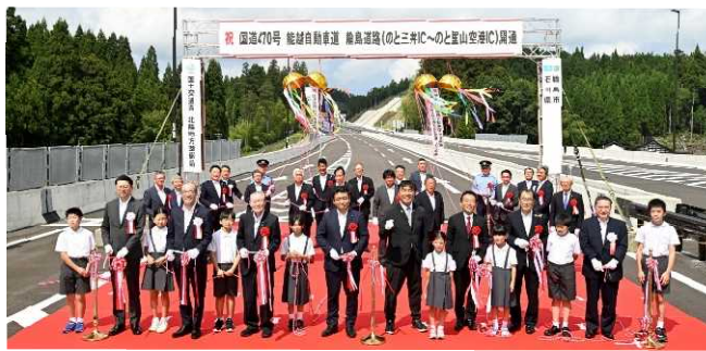
開通式典に参加した三井小学校の児童たち (R5.9.16)