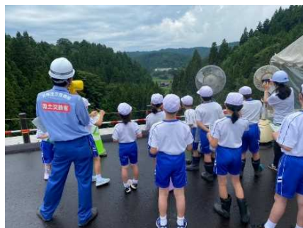
開通前の見学会で能越道から三井小学校を臨む児童たち (R5.7.14)

・道路整備で使われた材料を用いた能越道クイズや工事で産出した木の化石「珪化木」 けいかぼく を手にとって観察するなど、インフラ整備を楽しく学びながら、ふるさとについて学習します。