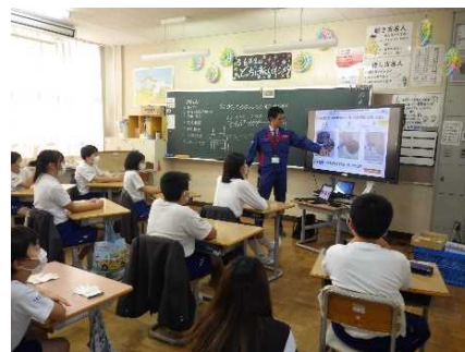
教室での総合学習イメージ (R5.10.23: 河原田小学校)