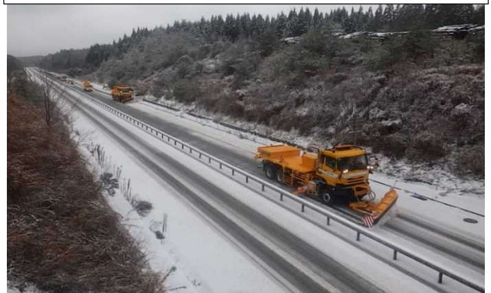
能越自動車道 穴水道路 除雪状況 令和4年12月