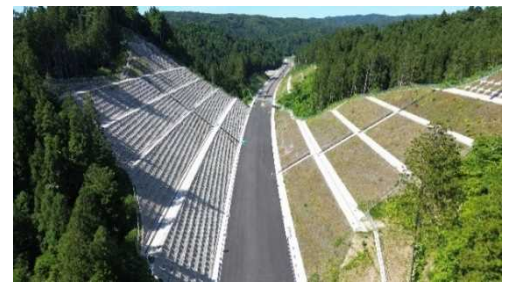
三井町長沢地区の状況