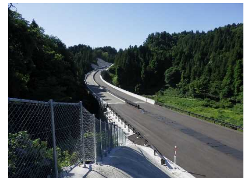
三井町小泉地区の状況