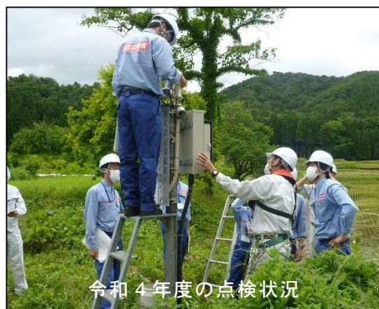
令和4年度の点検状況