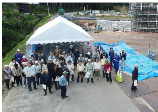
平成30年度の見学会の状況