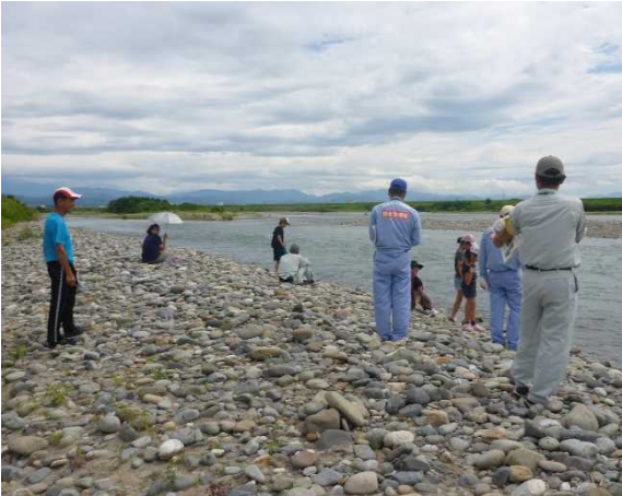
【手取川での点検状況】