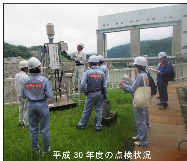
平成30年度の点検状況

※ 詳細な点検箇所及び時間（予定）は，別紙のエリア図，点検ルートをご参照下さい。 なお，現場状況等により，点検ルートを変更する場合がありますので，取材される場合は，下記問い合わせ先にご連絡下さい。