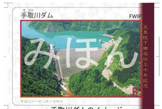
手取川ダムのイメージ (石川県白山市)

こちら⇒ http://www.hrr.mlit.go.jp/kanazawa/chisui