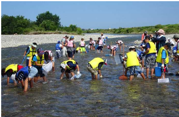
水生生物を採取している様子 (手取川)