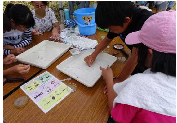
水生生物を分類している様子 (梯川)